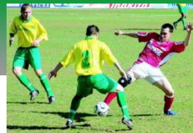
Gagauzia y Groenlandia en la ELF Cup (derecha), el torneo que sucede a la FIFI Wild Cup alemana